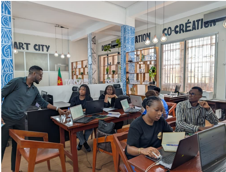
Séance de formation du 11 avril 2026, organisée au Diver City Space de Yaoundé.

Félicitations à tous pour cette belle réussite ! Nous sommes ravis de participer à cette aventure et espérons sincèrement que vous réussirez les prochaines étapes du programme. Puissent les graines semées aujourd'hui donner naissance à des arbres fructueux, révélant chez chaque jeune participant une vocation pour cartographier le monde !